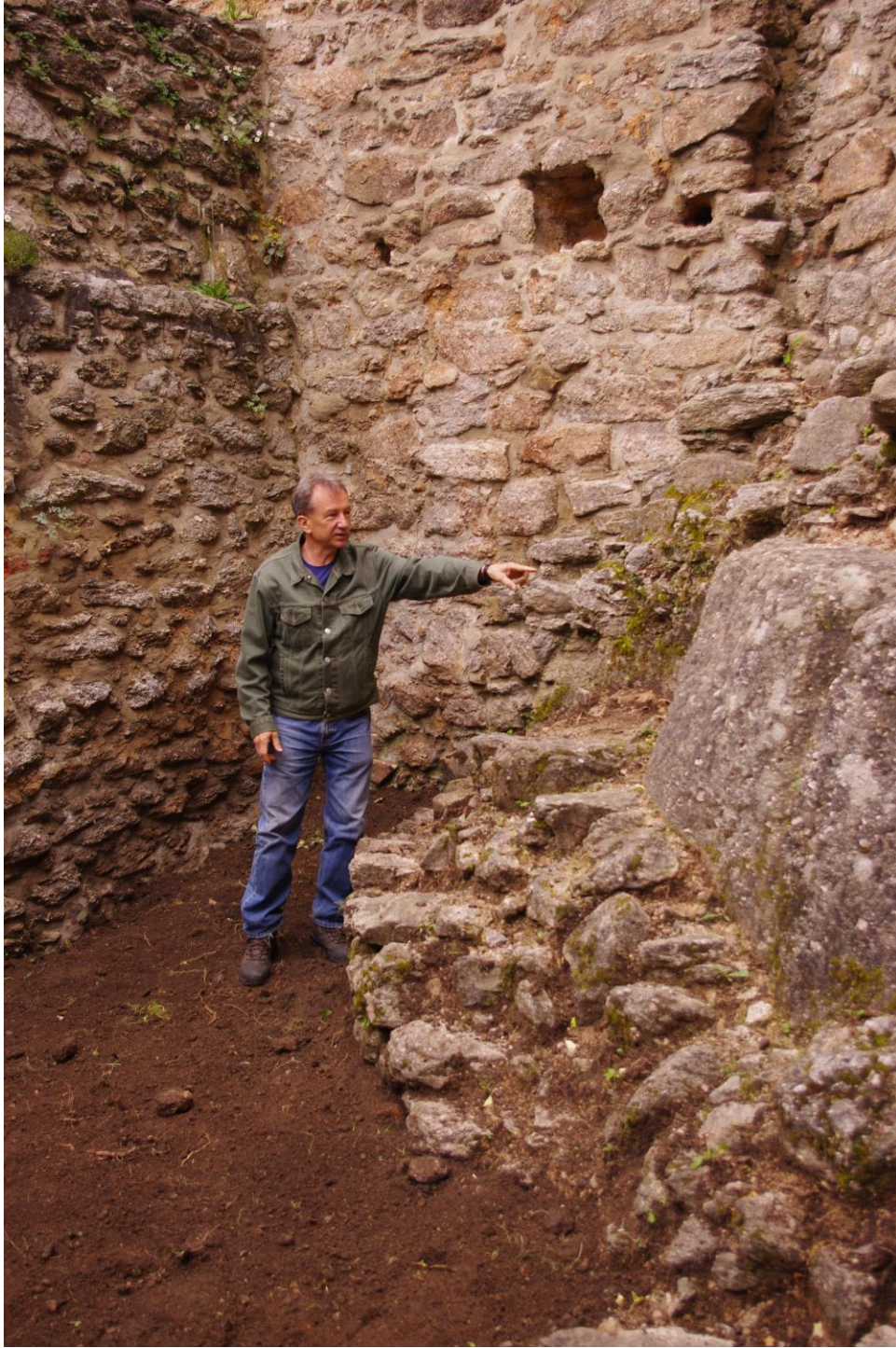
Prof. Jerzy Piekalski przy fundamentach nowoodkrytej wieży

Prowadzono też prace w zewnętrznej, zachodniej części zamku, na bastionach (wykop nr 2), poszukując domniemanej baszty zachodniej. Odkopano na razie fragmenty murów oporowych, a ciąg dalszy badań w tym miejscu planowany jest w przyszłym roku. Więcej szczegółów podamy po naukowym opracowaniu wyników badań przez Instytut Archeologii Uniwersytetu Wrocławskiego.