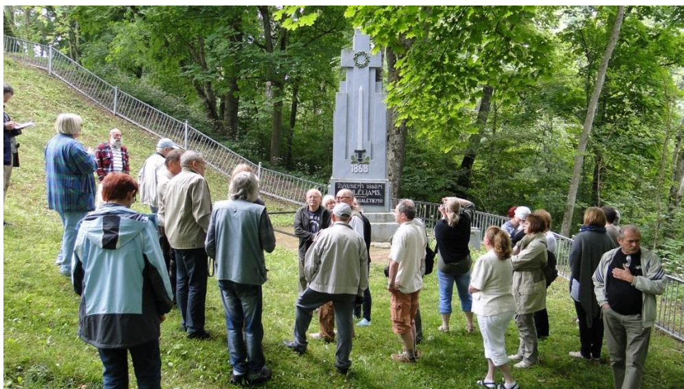
Pomnik upamiętniający 75 powstańców 1863 r. w miejscowości Świętobrość