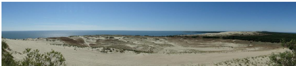
Widok z najwyższej wydmy na Mierzei Kurońskiej

Patrząc na te rozległe widoki, czując panujący tu spokój, no i oczywiście ze względu na ładną pogodę, nie dziwimy się słowom przewodniczki, która podpowiada, że gdybyśmy zechcieli tu przyjechać na odpoczynek, to miejsca powinniśmy rezerwować już teraz na przyszły rok. Później będą znikome szanse na powodzenie takiego pomysłu.