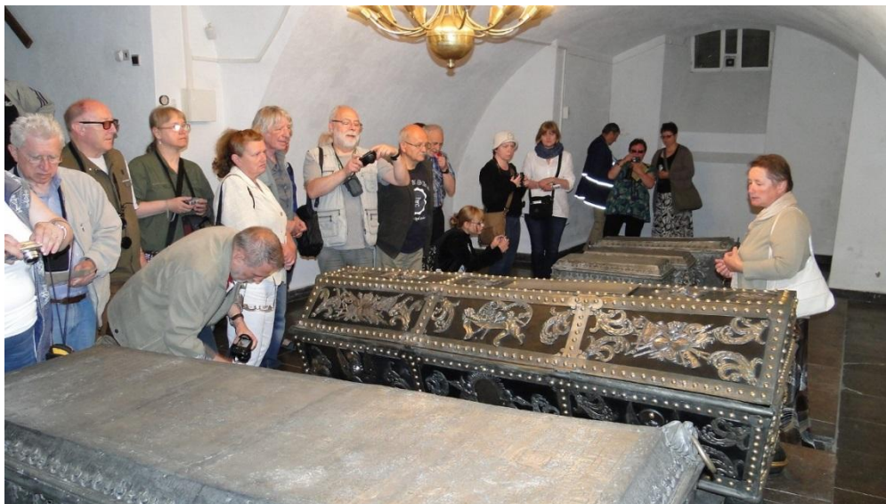
Krypta z sarkofagami Radziwiłłów

Zanim wyruszymy dalej wracamy na chwilę do Kiejdan gdzie zachodzimy do zboru kalwińskiego, w którego podziemiach zostali pochowani Radziwiłłowie, m.in. Janusz. Znajduje się tam kilka pięknie odrestaurowanych sarkofagów. Ze względu na przepisy utrzymywana jest tutaj stała temperatura (14 stopni Celsjusza) oraz wilgotność (67 %). Na razie wyposażenie kościoła jest bardzo ubogie. Ładna ambona z XVII wieku, trochę ławek, wystawa fotografii, ot i wszystko. Sprzyja to powstawaniu pogłosu, który skutecznie uniemożliwia wyraźne wystuchanie tego co mówi przewodniczka. Dopiero teraz możemy docenić wyjątkową zaletę wspomnianych ławek. Są one tak wykonane, że oparcia można pochylać na obie strony, co pozwala na siedzenie w jedną albo w drugą stronę. Obecnie obiekt ten jest jednostką muzealną i odbywają się tu koncerty.