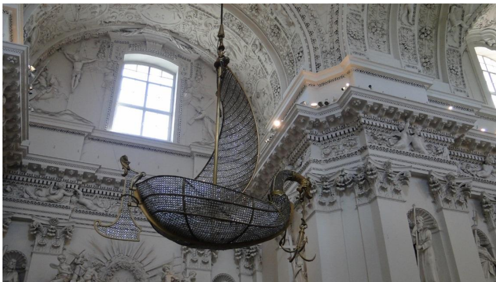
Łódź Piotrowa w kościele św. Piotra i Pawła w Wilnie

Pod koniec XVII wieku, na zlecenie hetmana polnego Michała Kazimierza Pacy, został wzniesiony kościół św. Piotra i Pawła. Jest to jedna z ładniejszych świątyń. Wewnątrz oprócz wielu rzeźb i ozdób naszą uwagę przykuje zawieszona pod sufitem łódź Piotrowa wykonana z tysięcy kryształów. Dzisiaj akurat trafiliśmy na mszę i nie bardzo mogliśmy podziwiać te wspaniałości. Wykorzystaliśmy jednak krótką chwilę kiedy to wierni wyszli na zewnątrz by przejść wokół kościoła z procesją. Okazuje się bowiem, że tego typu manifestacje nie zawsze są dopuszczane na ulice miasta. Z konieczności muszą one czasami odbyć się na terenie kościelnym.