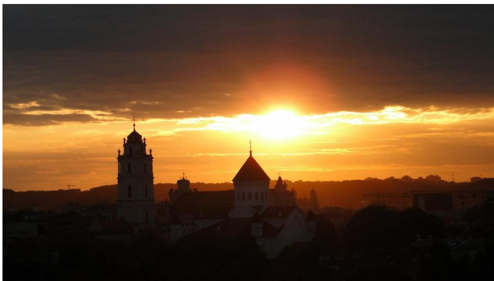
Słońce udaje się na spoczynek, Wilno zapada w sen

Rankiem następnego dnia żegnamy Wilno, już tu nie wrócimy. Dzisiejszy dzień poświęcony będzie odwiedzeniu miejsc związanych z życiem Józefa Piłsudskiego. Zanim jednak to nastąpi docieramy do miejscowości Ciechanowiszki. W jednej z