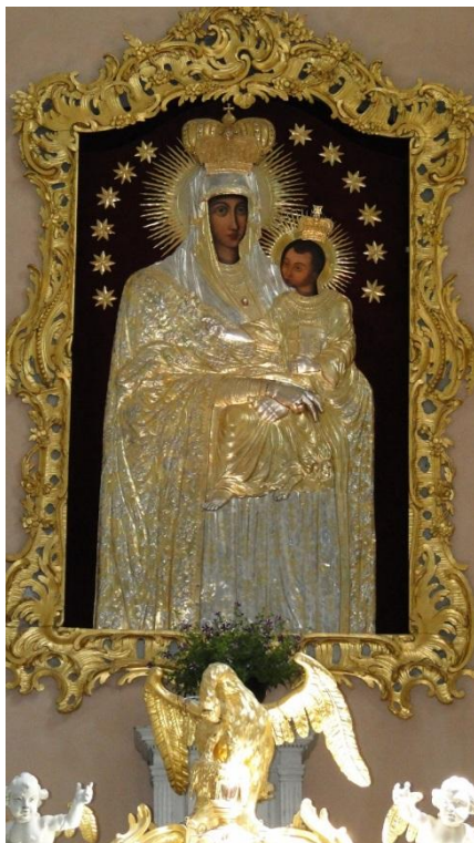
Obraz Matki Boskiej w Szydłowie

Dlaczego jednak nie jest to Częstochowa? Oczywiście wszystko zaczęło się od cudu. Gdy Matka Boska ukazała się pastuszkowi, a ten przekazał jej słowa kapłanom, ci uznali to za cud. Jest to jedno z najstarszych objawień w Europie i prawdopodobnie jedyne, gdy Maryja przemówiła do człowieka, który nie był katolikiem. Różne zbiegi okoliczności doprowadziły do stanu dzisiejszego świątyni. Najważniejszym był wygrany proces z kalwinami i otrzymanie odszkodowania za zagarnięte mienie kościelne. Jak widać były to dobrze spożytkowane pieniądze. Faktem jednak jest też to, że obraz Matki Boskiej został namalowany na zamówienie w Londynie w wieku XVIII.