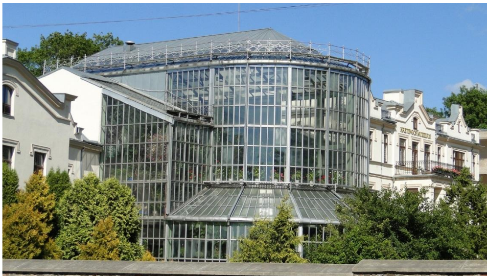
Oranżeria przy pałacu Tyszkiewiczów w Krynicy

w takim miejscu na długo zapadnie w naszej pamięci, ciekawe tylko czy z powodu właśnie tego wyjątkowego otoczenia, czy z powodu gorąca jakie tutaj panuje.