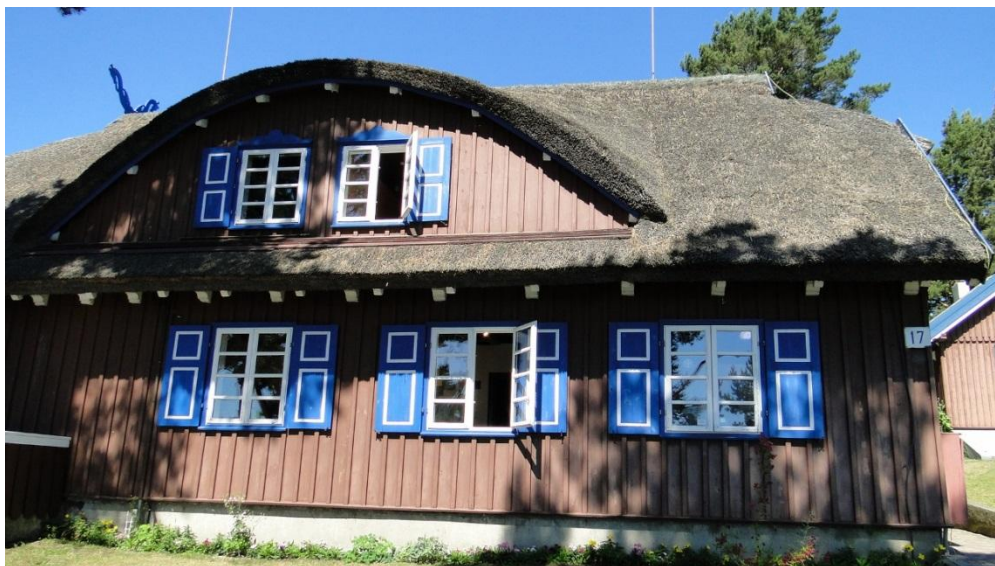
Dom Tomasza Manna