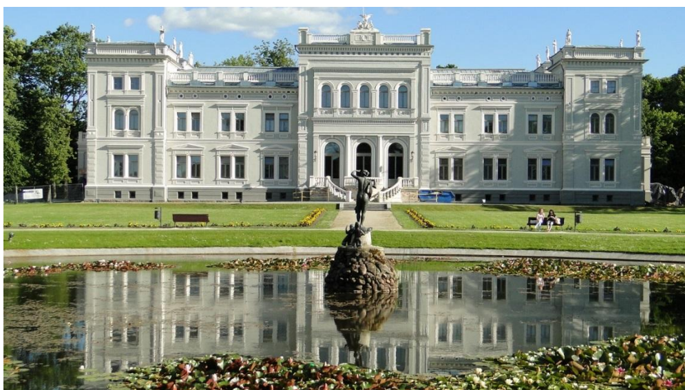
Pałac Ogińskich w Płungianach

metalową makietę całego kompleksu dzięki czemu z układem zabudowy wzgórze mogą zapoznać się także osoby niewidome. Dalszy spacer po mieście to już czysta przyjemność, droga do centrum prowadzi ciągle w dół. Na początek możemy zrobić sobie pamiątkowe zdjęcie przy rzeźbie przedstawiającej niedźwiedzia niosącego na grzbiecie rozbawione misie i dzieci. Później, już przy pomniku z zegarem, warto przemóc się i spróbować swoich sił w specjalnej grze. Ten kto ją wymyślił powinien dostać nagrodę. Otóż na ruchomej platformie umieszczono wizerunki zabytków a pomiędzy nimi wyryto nieckę rzeki, którą należy przetoczyć kulkę. Gwarantuje świetną zabawę i ręczę, że nie będzie to wcale takie łatwe.