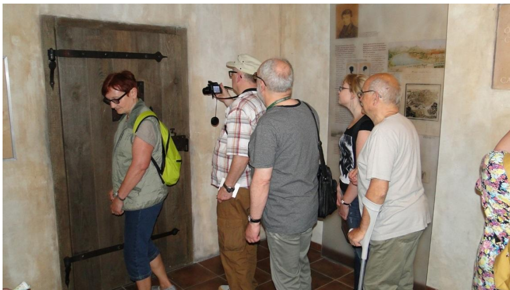
„Chętni do celi Konrada”

Kilkaset metrów dalej znajduje się przejście zwane Bramą Adama Mickiewicza. To właśnie przez nią prowadzono Adama po aresztowaniu. Klasztor Bazylianów, do którego prowadzi owa brama służył wówczas jako więzienie. Oczywiście miejsce to upamiętnia także innych znanych Polaków. Jednym z nich jest Ignacy Domeyko, późniejszy bohater narodowy Chile. Odwiedzających to miejsce przyciąga fakt więzienia tutaj członków tajnego Towarzystwa Filomatów, wśród nich wspomnianego Adama Mickiewicza. Tak się złożyło, że poeta zainspirowany tym miejscem, umiejscowił tu scenę przemiany bohatera Dziadów . Dzisiaj wiemy już, że nie jest to dokładnie to samo miejsce (właściwa cela została połączona z inną w większą salę) ale cóż to znaczy dla pobudzonej wyobraźni turystów. Wystarczy przecież popatrzeć na ustawioną kolejkę chcących zajrzeć do celi przez judasza. Tylu chętnych „do celi” jeszcze nie widziałem.