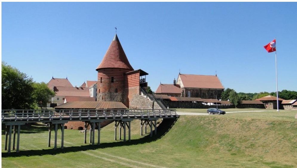
Zamek w Kownie

Co prawda nie do końca wiadomo o co chodzi ale budynek jest niczego sobie. W cieniu rosnących drzew można dostrzec młodych artystów malujących ten obiekt. Faktem jest, że jako kamień węgielny użyto tutaj beczutki miodu pitnego. Może właśnie ów fakt, a właściwie, co jest rzeczą zupełnie naturalną, kosztowanie trunku doprowadziło do takiego postrzegania przyszłej siedziby władz – Biały Łabędź.