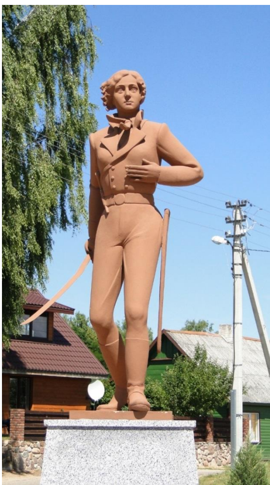
Pomnik Emilii Plater w Kopciowie