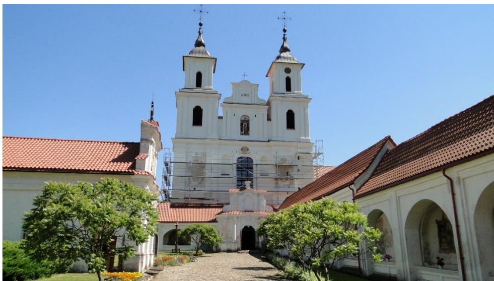
Cytowiany – pobernardyński zespół klasztorny

Oczywiście w okolicy mieszkali także członkowie mniej znanych rodów. Np. w miejscowości Kielmy zachował się spory dwór (właśnie remontowany) wzniesiony przez Grużewskich. Warto tutaj zobaczyć widok poprzez paradną bramę wjazdową, w której, ze względu na jej wielkość, właściciel przechowywał swoją bibliotekę.