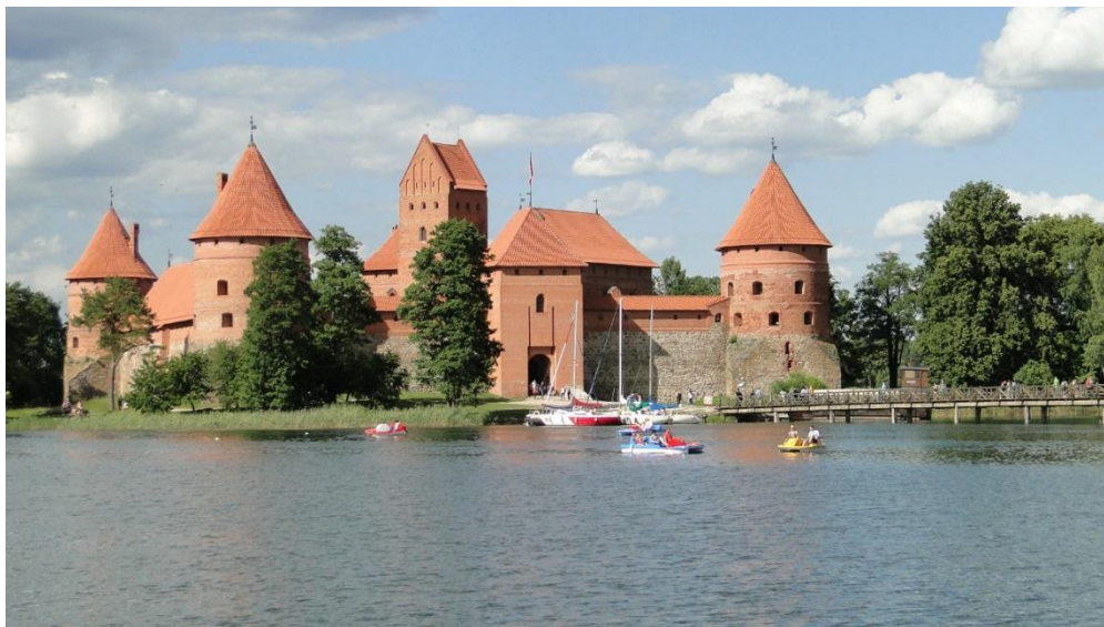
Zamek w Trokach