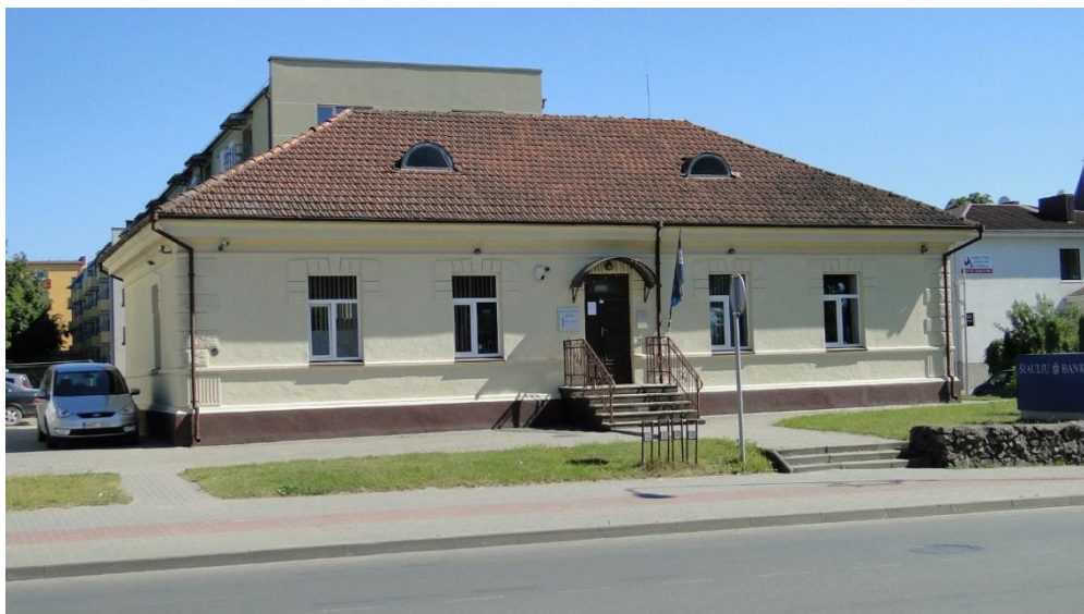
Budynek poczty, na której nadawał swoje listy Honoré de Balzac