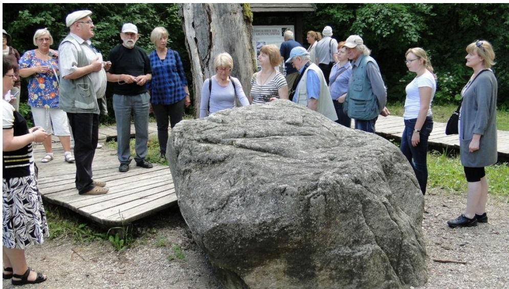
Tajemniczy głaz w dąbrowie koło Dukszt