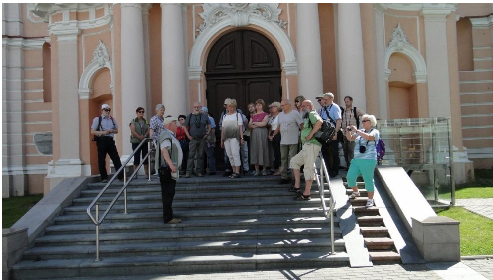
Na schodach kościoła św. Kazimierza