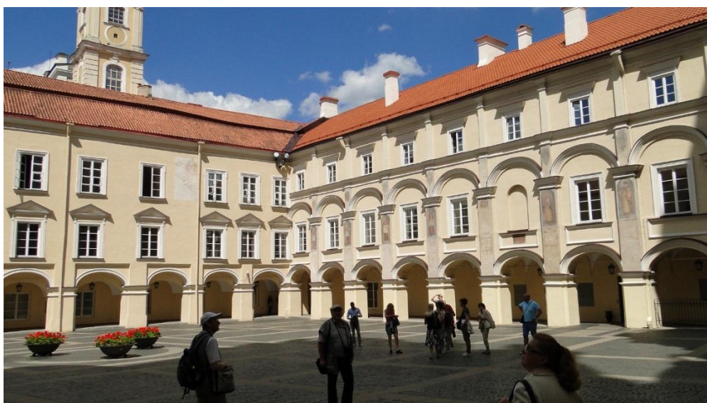
Dziedziniec Uniwersytetu Wileńskiego

Ale oto przed nami kompleks Uniwersytetu Wileńskiego im. Stefana Batorego, powstały na bazie Kolegium Jezuitów. Jest to zespół złożony z kilkunastu budynków, tyłuż dziedzińców, kościoła i dzwonnicy. Wszystko w jednym miejscu. To niezwykle praktyczne. Ciekawostką jest tutaj pewne pomieszczenie w podziemiach kościoła św. św. Janów, w którym zamykano leniwych i niegrzecznych studentów. Nawet na tydzień. Efekt wychowawczy zawsze był taki sam. Okazanie skruchy i wykazanie