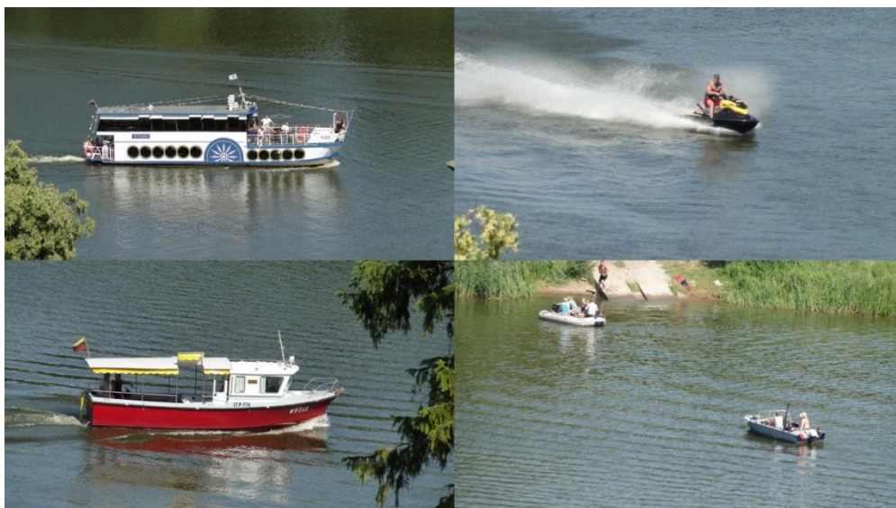
Niemen w Birsztanach