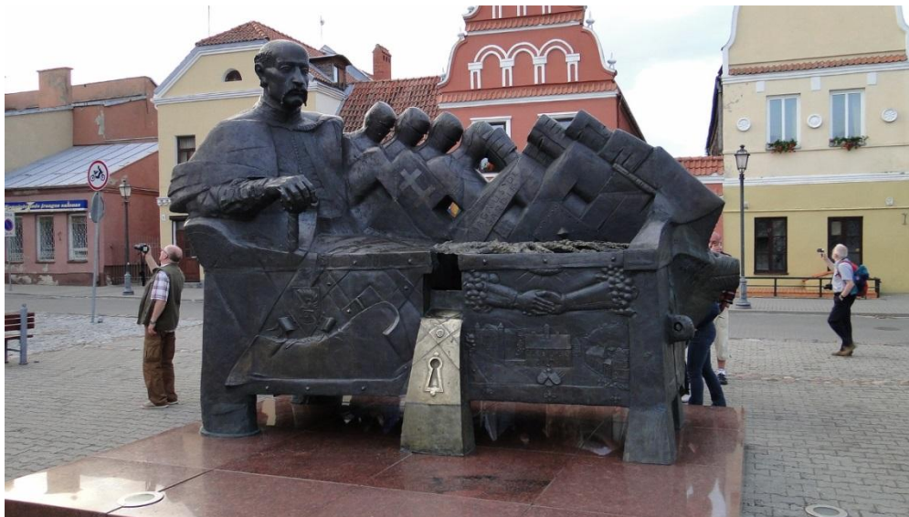
Pomnik Janusza Radziwiłła w Kiejdanach

Aby jednak nie rozpatrywać zbyt długo kto ma rację najlepiej jest udać się na sąsiednią ulicę, gdzie już z daleka widzimy bardzo ciekawą fasadę. W każdym z okien zamieszczono różnego rodzaju wesołe przedstawienia. Są to najczęściej tańczący i bawiący się ludzie. Takich miejsc jest tutaj więcej. Np. na terenie dawnego cmentarza przy zborze luterańskim zbudowano kolorową fontannę. Jest tutaj także scena, na której świętowano uzyskanie niepodległości. Najchętniej jednak pamiątkowe zdjęcia turyści robią sobie na Knipawskim rynku siadając na murku niewielkiej fontanny, w której umieszczono przedstawienie serca zakrytego sierpem księżycy chroniącym je przed deszczem.