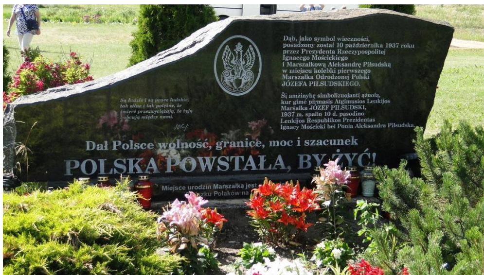
Miejsce urodzin Józefa Piłsudskiego

My ponownie wracamy na szlak związany z Józefem Piłsudskim. Najpierw docieramy do miejscowości Powiewiórka, gdzie w miejscowym kościele został on ochrzczony, a następnie do Zułowa, w którym marszałek przyszedł na świat.