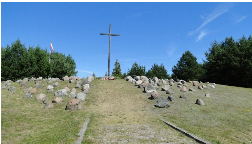
Giby – miejsce upamiętnienia tych, którzy oddali życie za Ojczyznę

bez chwili zamyślenia. Właśnie mijamy miejscowość Giby, w której widzimy niewielką górkę z wielkim drewnianym krzyżem na jej szczycie. Całe zbocze pokryte jest dużymi głazami ustawionymi tak, iż patrząc na nie z boku wydaje się, że próbują one „iść” pod górę, w stronę krzyża. Miejsce to upamiętnia ponad 600 ofiar tzw. obławy lipcowej (augustowskiej) mającej miejsce w 1945 roku. Wtedy to właśnie specjalne oddziały NKWD dokonały aresztowań wśród miejscowej ludności. Niektórzy z aresztowanych, po przesłuchaniu wrócili do domów. Niestety los ponad 600 z nich jest nieznanym do dnia dzisiejszego. Nikt nie wie co się z nimi stało. Po prostu rozplynęli się w powietrzu. Autorem instalacji upamiętniającej zaginionych jest Andrzej Strumiłło. Umieszczono tu kilka tablic kamiennych z nazwiskami zaginionych. Pomnik ten poświęcono nie tylko ofiarom tej jednej zbrodni. Poświęcono go pamięci wszystkich, którzy życie, krew i cierpienie złożyli w ofierze Ojczyźnie. Dotyczy to zarówno poległych w powstaniu listopadowym 1830 czy styczniowym 1863, jak i podczas odradzania naszego państwa w latach 1918-1921, po okresie niewoli. Dotyczy to także obrońców Ojczyzny w okresie II wojny światowej oraz więźniom zamordowanym w obozach koncentracyjnych i łagrach a także pomordowanym w okresie powojennym. Jak zaznaczono na tablicy wszyscy oni zginęli bo byli Polakami.