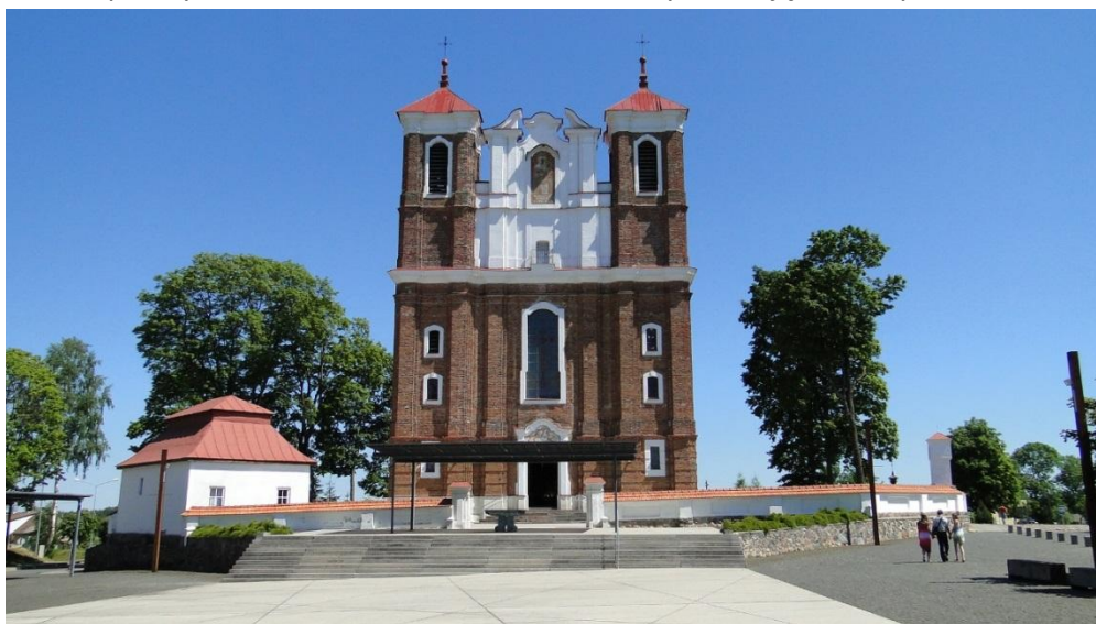
Sanktuarium Maryjne w Szydłowie

za jedno z najstarszych i największych sakralnych założeń barokowych na Litwie. Ponieważ przybywało tutaj często po kilkadziesiąt tysięcy pielgrzymów obiekt został tak zaprojektowany, że liczne krużganki pozwalały im na schronienie. Do tego na ścianach umieszczono drogę krzyżową. Poszczególne stacje wykonano jako obrazy naścienne lub jako sceny płaskorzeźbione. Ciekawostką jest tutaj panorama miasta znajdującego się za murami namalowana nad bramą wyjściową z krużganków. Tak nad bramą wyjściową! Zakonnicy bowiem tu żyjący czasami mieli pokusę by wyjść za mury i zobaczyć jak wygląda normalne życie. A tak, podchodząc do bramy spoglądali na górę i często widok namalowanego miasta wystarczał im, by nie kusić złego. Zostawali po tej stronie bramy. Na pokutę zaś udawali się do wzniesionej centralnie kaplicy loretańskiej, w której po przejściu świętych schodów, ochota na dalsze spacerować całkowicie im odchodziła. Kolana wystarczająco bolały.