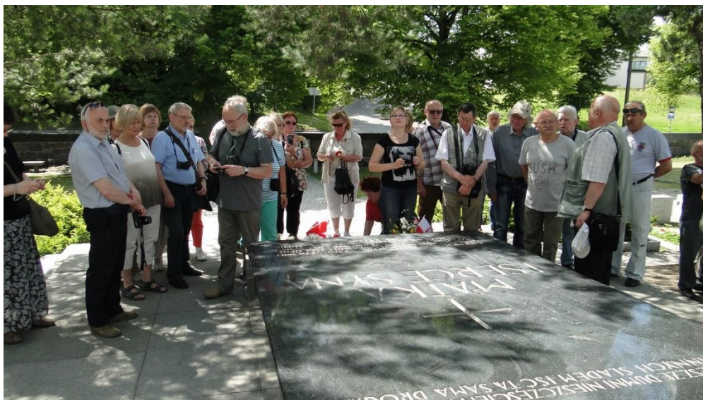
Nekropolia na Rossie – przy grobie „Matki i serca syna”

Musielimy przecież wybrać się na spacer w okolice góry, na której dawno temu zatrzymał się Gedymin wraz ze swoją żoną, po udanym polowaniu. To właśnie owej nocy przyśnił mu się wilk. Zapytany o znaczenie snu kapitan roztoczył tak piękne wizje przez księżycem, że ten nakazał zbudowanie na górze zamku. Z czasem przeniósł tu stolicę z Trok i w ten właśnie sposób postać wilka ubranego w pancerz trafiła do symboliki litewskiej. Dzisiaj po zamku pozostała jedynie jedna z wież, za to zbudowana z czerwonej cegły. Daje ona wyobrażenie jak trudny był to do zdobycia obiekt. Oczywiście kto nie chce się tu wspinać pod stromą górą może przejść na drugą stronę i skorzystać z wyciągu.