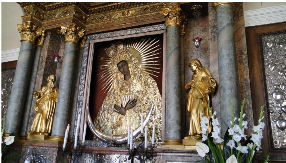
Obraz Matki Boskiej Ostrobramskiej