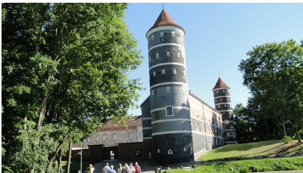
Zamek w Jurbork

Niezwykle pozytywne wrażenie wywarł na nas inny równie wielki zamek, może nawet większy. W każdym razie ujrzeliśmy go już z daleka. Jego potężne mury i wysokie wieże wznoszą się na skarpie nad Niemnem. Jednak dopiero gdy znajdziemy się na dziedzińcu dociera do nas jego ogrom. I to mimo wyburzenia jednego skrzydła, które przeszkadzało ówczesnemu właścicielowi zasłaniając