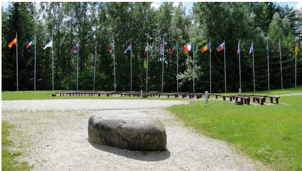
Centrum Europy w miejscowości Bernaty koło Wilna

urządzono tu korty tenisowe. Można zatem korzystać do woli z ruchu na świeżym powietrzu. Można także przenocować tu czy zjeść coś smacznego.