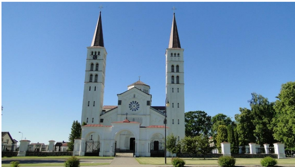
Kościół w Retowie

Ponieważ na dzień dzisiejszy ulokowano tu wystawę poświęconą Michałowi Kleofasowi Ogińskiemu możemy dowiedzieć się wiele ciekawych faktów z jego życia.