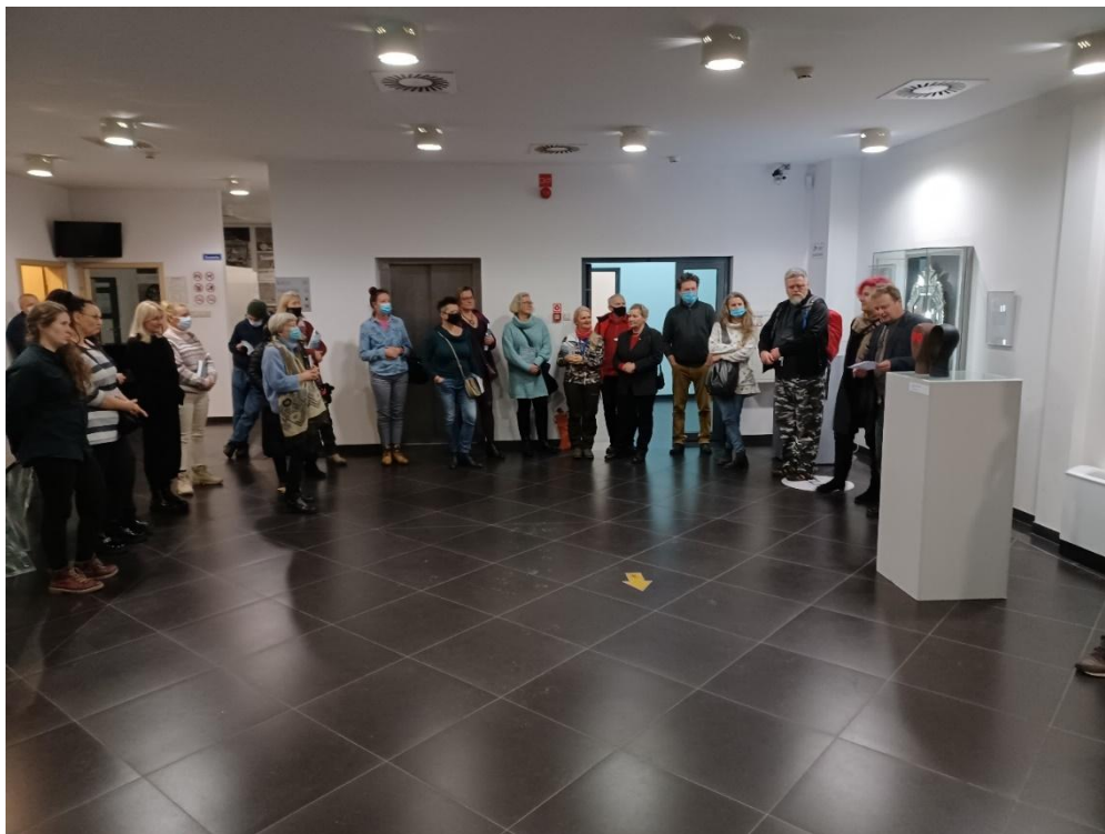
Otwarcie wystawy „Transgresje”